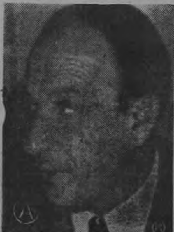
Don Francisco J. Orlich