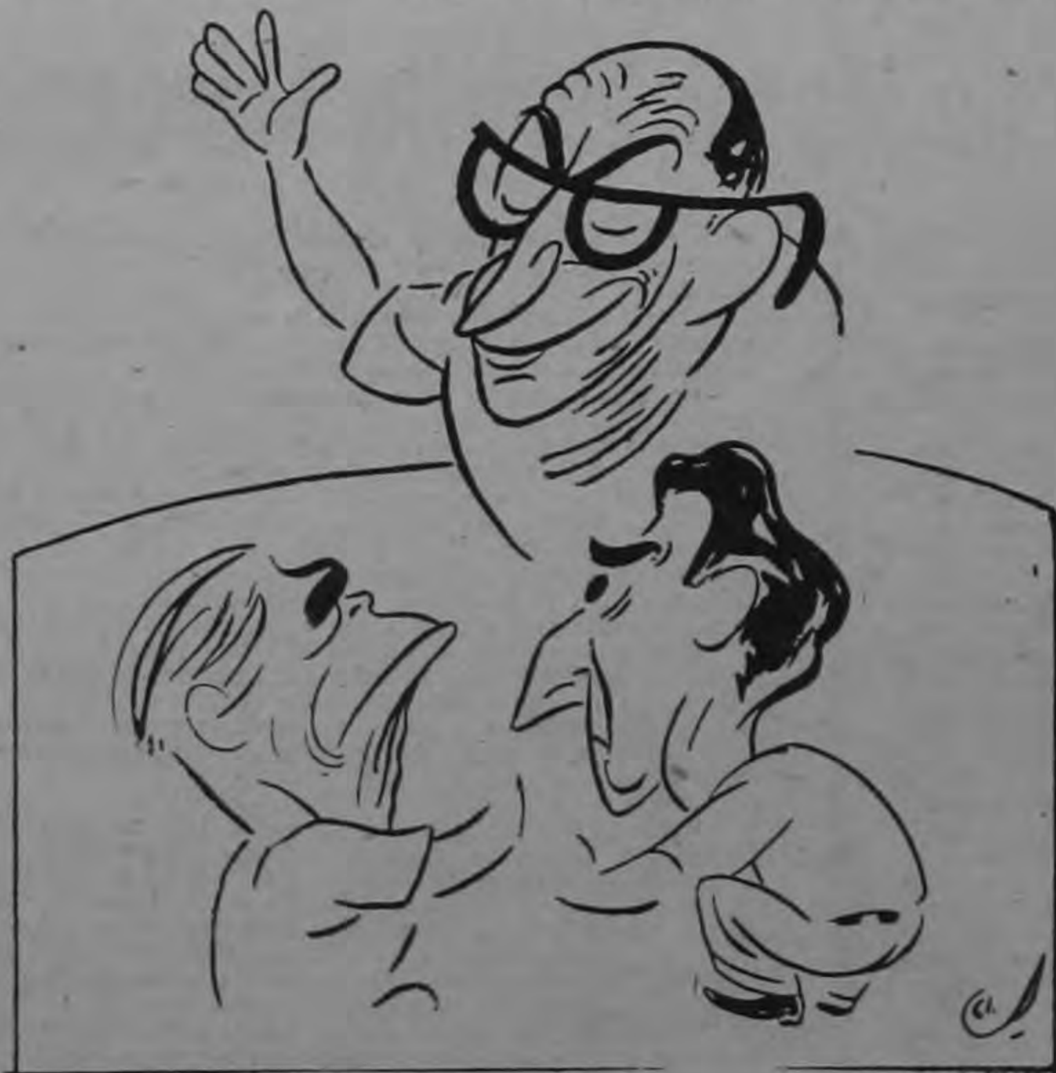
DON CHICO.—¡Ah, pero un momento, que oquí va la mía...!

Por T. V. Canal 7, caras conocidas se brindaron leña.